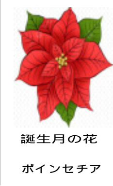
誕生月の花 ポインセチア